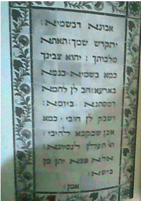
Vavaky ny Tompontosika amin'ny teny arameanina.